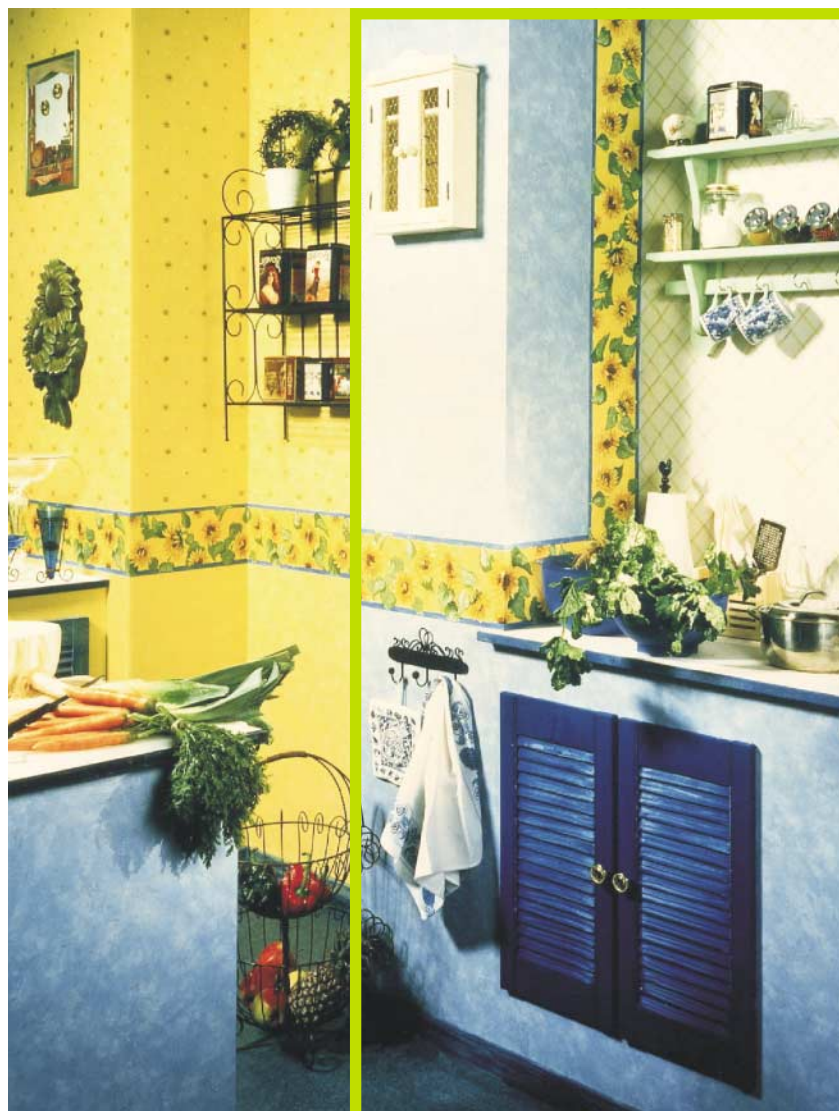
Wohnen hat viele Gesichter – Tapete auch

In Zusammenarbeit mit dem RAL, Deutsches Institut für Gütesicherung und Kennzeichnung e.V. in St. Augustin, der wichtigsten Autorität im Bereich der Gütesicherung, wurden strenge Gütebestimmungen für Tapeten erarbeitet, deren Einhaltung laufend von neutraler Seite überwacht wird (s. unten stehenden Kasten).