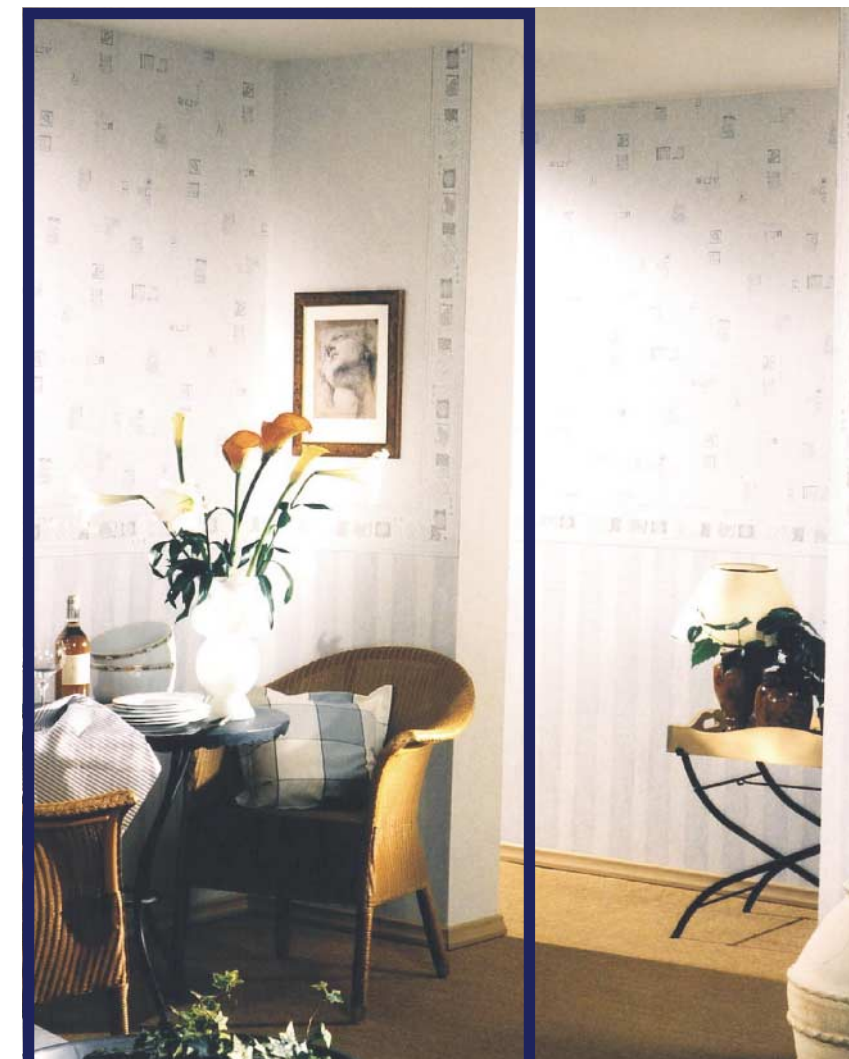
Tapeten machen das Wohnen schöner

Als Trägermaterialien werden für die Herstellung von PVC-Tapeten sowohl Papier als auch Spezialvliese eingesetzt. Sogenannte Duplex-Papiere bestehen aus zwei voneinander trennbaren Schichten, von denen eine nach